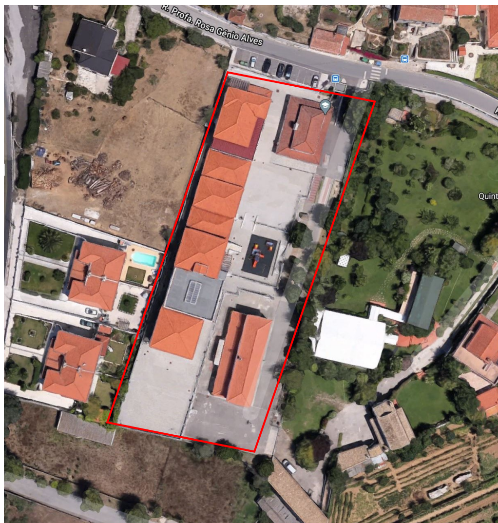
Ortofotomapa – Coordenadas GPS 38°49'13.8"N 9°17'24.8"W

A presente Memória Descritiva e Justificativa refere-se ao Projeto de Arranjos Exteriores de reabilitação e valorização do logradouro da Escola Básica do 1º Ciclo e Jardim de Infância Sabugo e Vale de Lobos , sita na Rua Profª Rosa Génio Alves – Sabugo 2715-395 ALMARGEM DO BISPO.