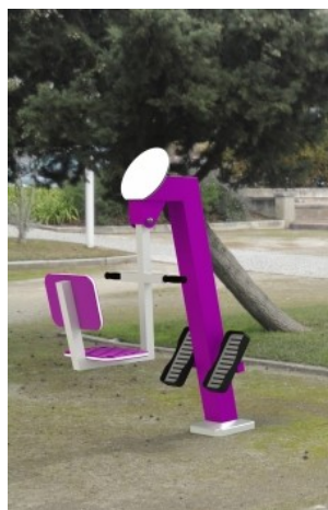
Balança K FIT 01