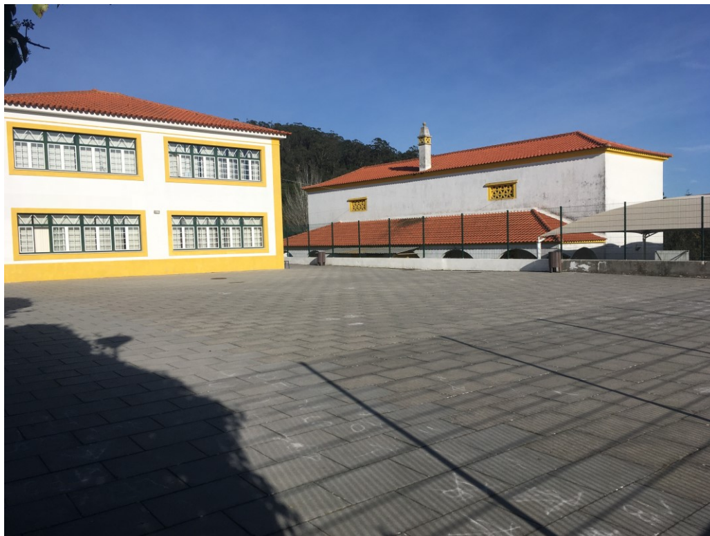
Recreio a sul do edifício principal – proposta de criação de campo de futebol

A sul do edifício principal encontra-se uma área de recreio subaproveitada, atendendo à área da mesma e a necessidade de áreas de jogo face ao número de alunos existente, é proposto um novo campo de futebol , em base cimentícia e revestida a resina acrílica, numa área de 150,00m 2 , envolvido em vedação para o efeito.