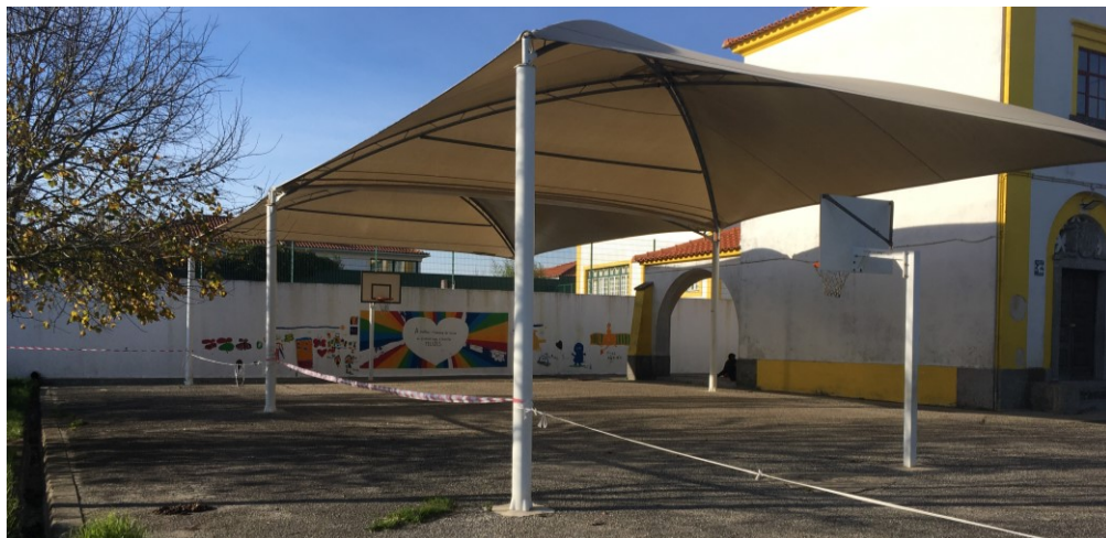
Atual campo de jogo

A proposta prevê a requalificação do campo de jogos existente através da colocação de equipamento e revestimento em resina acrílica, numa área de 330,00m 2 .