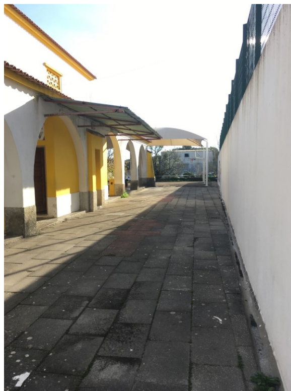
Zonas envolventes ao Plano Centenário – proposta de repavimentação global

Por se encontrar, atualmente, subaproveitado e sem a manutenção necessária, pretende-se uma recuperação que promova, valorize e potencialize este espaço de recreio e dar melhores condições às crianças para a realização de diversas atividades, essencialmente relacionadas com desporto e lazer.