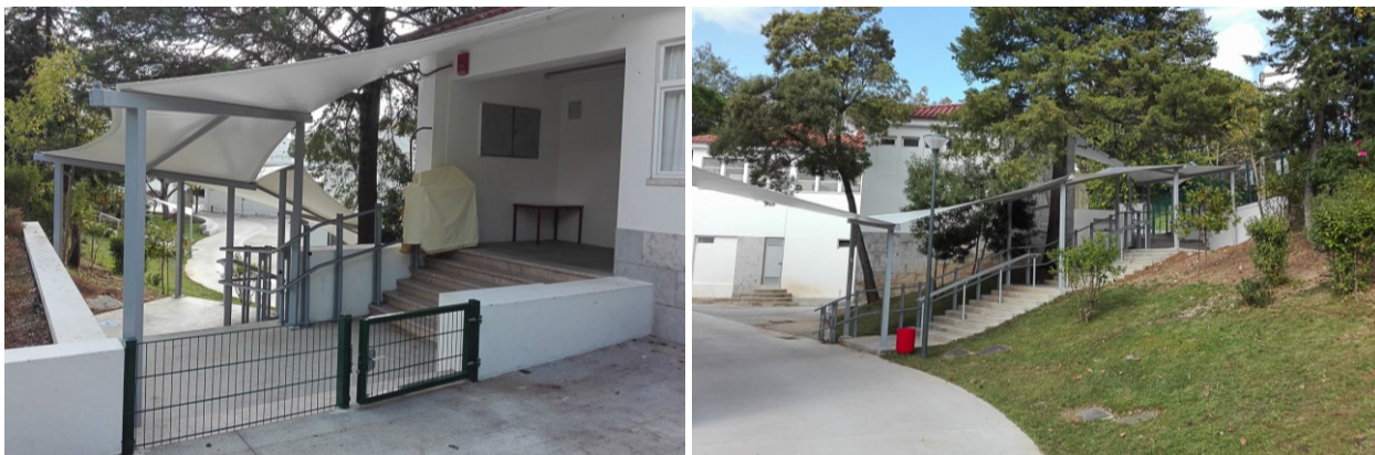
Exemplo de “túnel tensionado”

Por se tratar de uma obra de requalificação total do logradouro , serão ainda intervencionadas as zonas envolventes ao edifício , que apresentam alguns sinais de degradação propondo-se a sua requalificação , nomeadamente muros e muretes , substituição das tampas de betão , repavimentação e colocação de bebedouros e ecopontos .