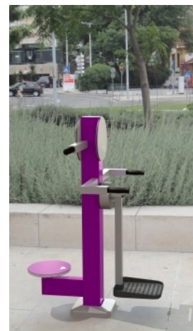
Cintura e Surf K FIT 35